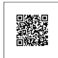
Zažádejte o vytyčení

Přílohy: Orientační zakres plynárenského zařízení, Detailní zakres plynárenského zařízení, Ověřená příloha žadatele